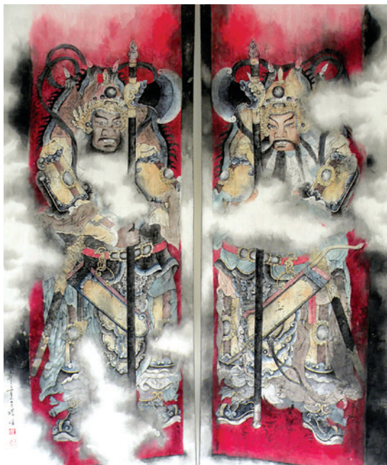
▲視媒系學生水墨畫作品「門神」。