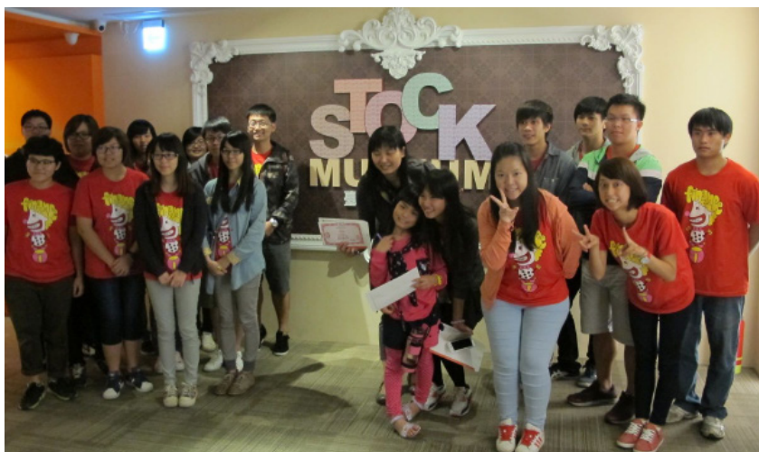
▲財金系學生參加優質企業參訪，與企業座談。