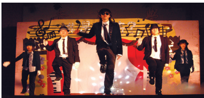
▼視媒系系周活動表演。