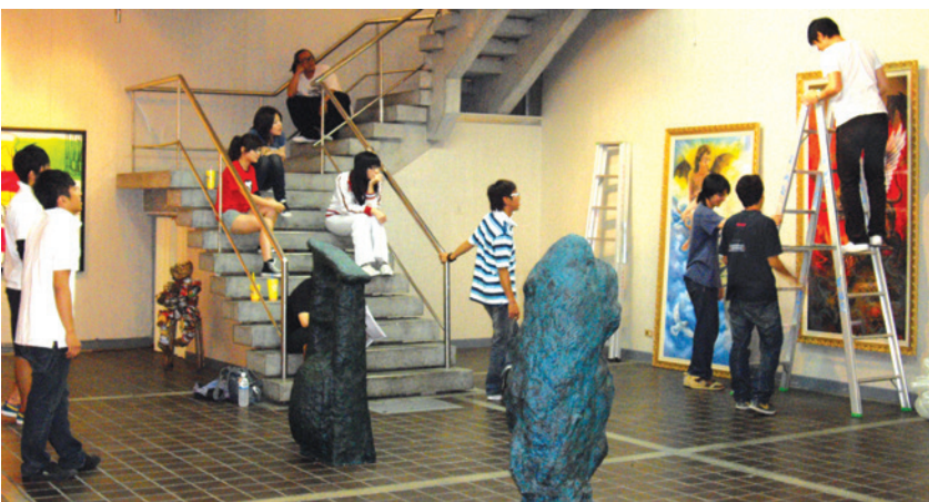
◀視媒系學生布置展覽會場。