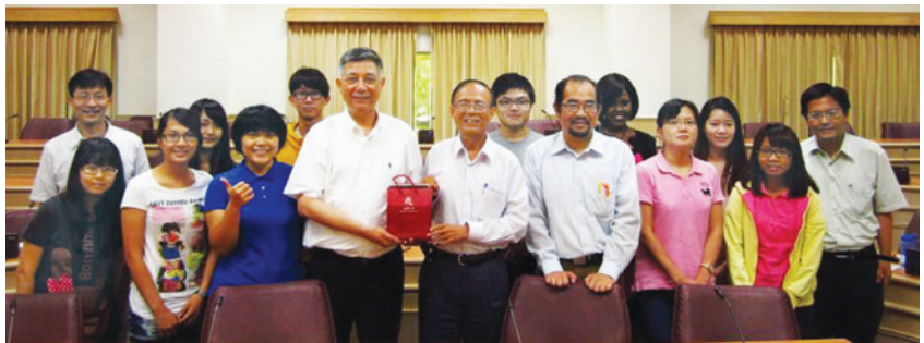
▲南華大學「2+2」雙學位說明會。

條件只要符合大學一年級或大學二年級全學年成績排名前50%、前兩年修滿通識學分和系