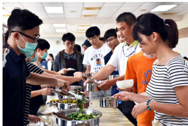
◆南華師生自行攜帶環保餐具用餐。

林聰明校長表示，從保育森林、維護綠地出發以及周遭環境安全做起，南華大學在建設中也不失「綠色」概念，在已啟用的建築中設有通過ISO-50001能源管理系統國際認證，採PDCA循環作業來有效監測用電量並做減量計畫，並利用太陽能板發電。同時，以「源頭減量、資源化、處理多元化」作為廢棄物處理主要原則，將資源循環利用。