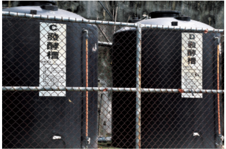
◆液化廚餘回收系統設備。

南華大學落實垃圾強制分類並廣設資源回收站，逐年降低垃圾量，資源回收率高達五成。同時，林聰明校長認為，宣導全校師生節約自然資源的使用，以減少廢棄物產生，同時讓廢棄物再回收，使資源可永續再利用，亦實施廚餘回收處理與落葉堆肥，採自然方式與用有益微生物菌群，分解廚餘殘渣，將其轉化為液態肥料；落葉與生熟廚餘則集中堆置，經過發酵、分解轉變成可當作肥料的腐質土。