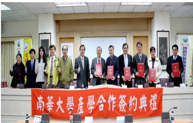
◆南華大學與全國補教協會簽訂產學合作。

南 華大學於106年再次獲得教育部教學卓越延續計畫共6000萬元，並列全國第三，再再顯示了近年來南華大學的辦學成效深受外界肯定。本次獲得教育部補助，除延續前4年的教學卓越績效，再以創新、深化、延展及加值教學卓越成果，並透過校務研究及大數據分析等方式，推動教學卓越，讓每一位南華人都能學用合一，未來進入職場，亮眼無限。