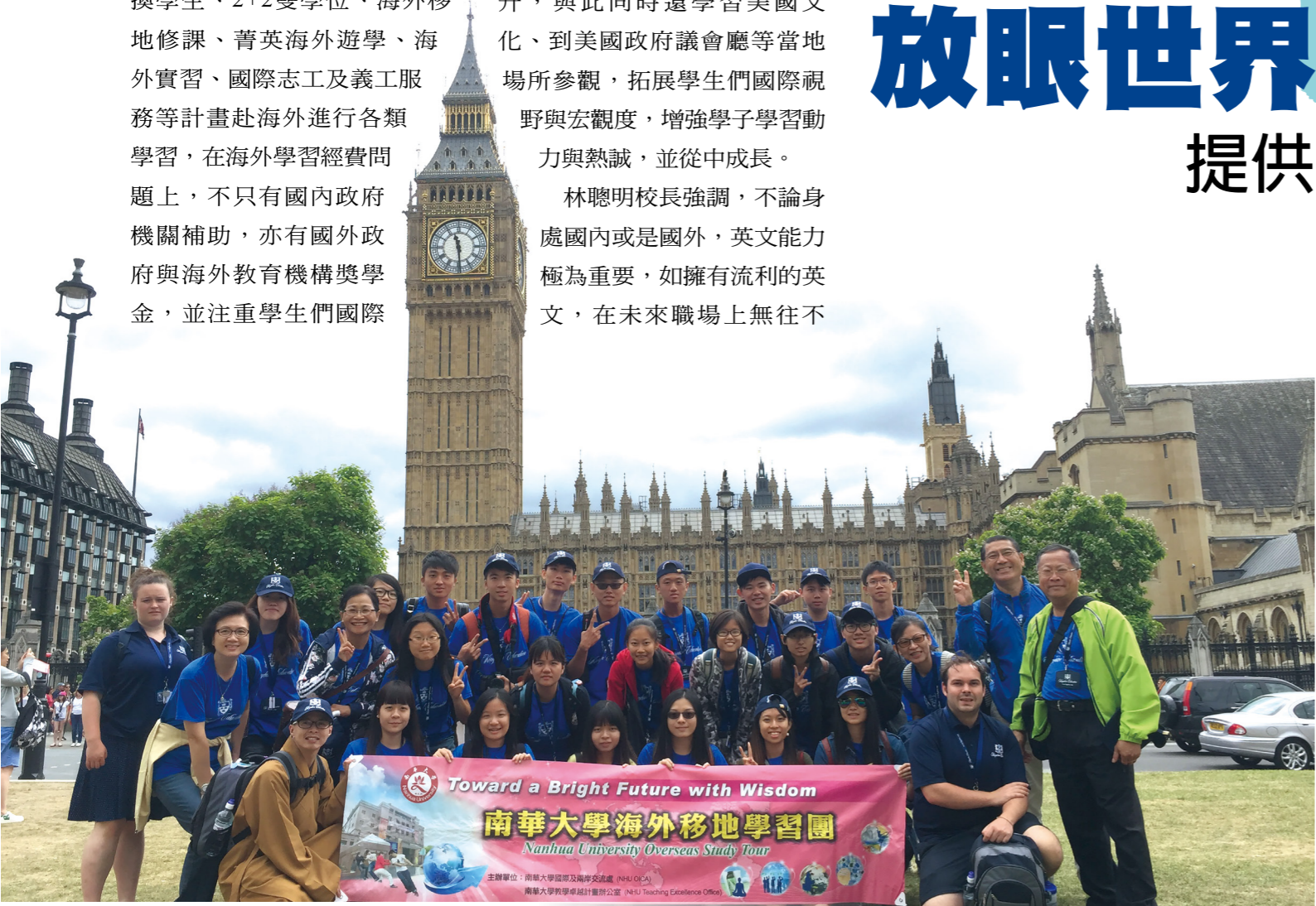
◆2016年暑假南華大學參訪劍橋大學團。