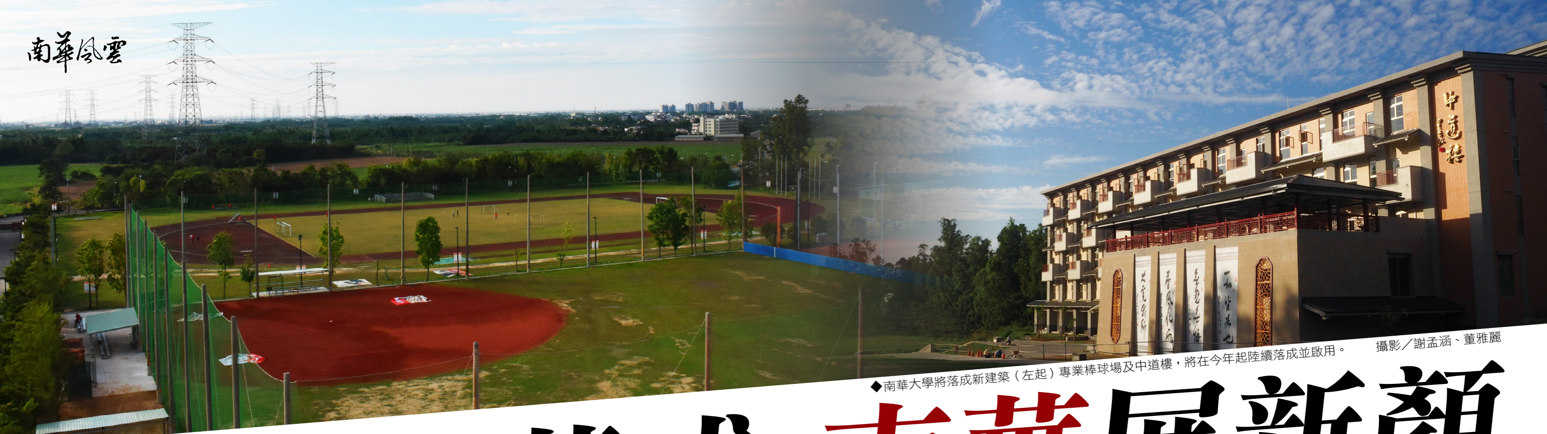
◆南華大學將落成新建築（左起）專業棒球場及中道樓，將在今年起陸續落成並啟用。