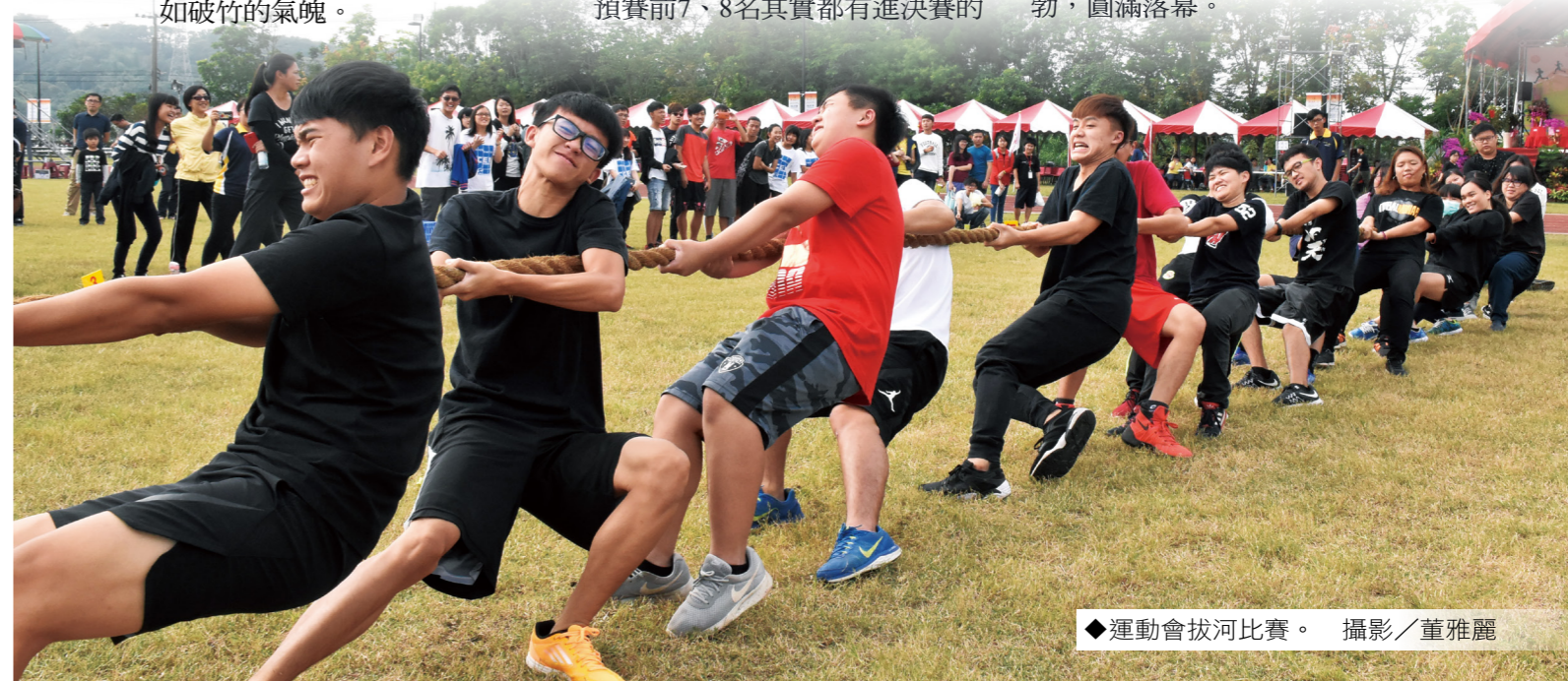
◆運動會拔河比賽。

本次運動會，不論田徑場上或是啦啦舞，都有不錯的表現，總結大會紀錄，由旅遊系獲精神總錦標第一名，第二、三名分別是視媒系及應社系，拔河比賽由視媒系勇奪冠軍，全體師生拿出三好精神，讓今年運動會朝氣蓬勃，圓滿落幕。