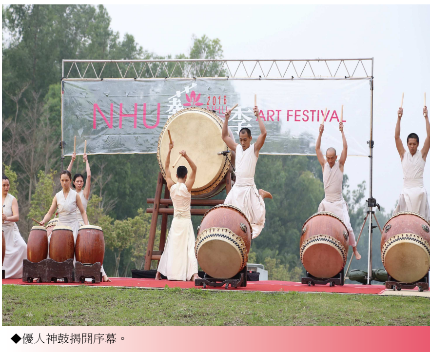
◆優人神鼓揭開序幕。

優人神鼓《鼓舞奔騰》表演，共有12位團員演出，其中有3位表演者是南華大學優秀的畢業校友，在藝術總監劉若瑀帶領之下，展現視覺、聽覺與表演的獨特融合，該劇團結合東方傳統武術、擊鼓、靜坐、太極導引、神聖舞蹈等元素，廣闊運用音樂、戲劇、文學、舞蹈、祭儀等素材，實踐道藝合一、東西交融理念的獨特表演方式，不但具體呈現台灣優質的劇場表演藝術，亦具有世界觀與當代美學之特點，與南華大學重視生命教育、推動正念靜坐的理念不謀而合。興