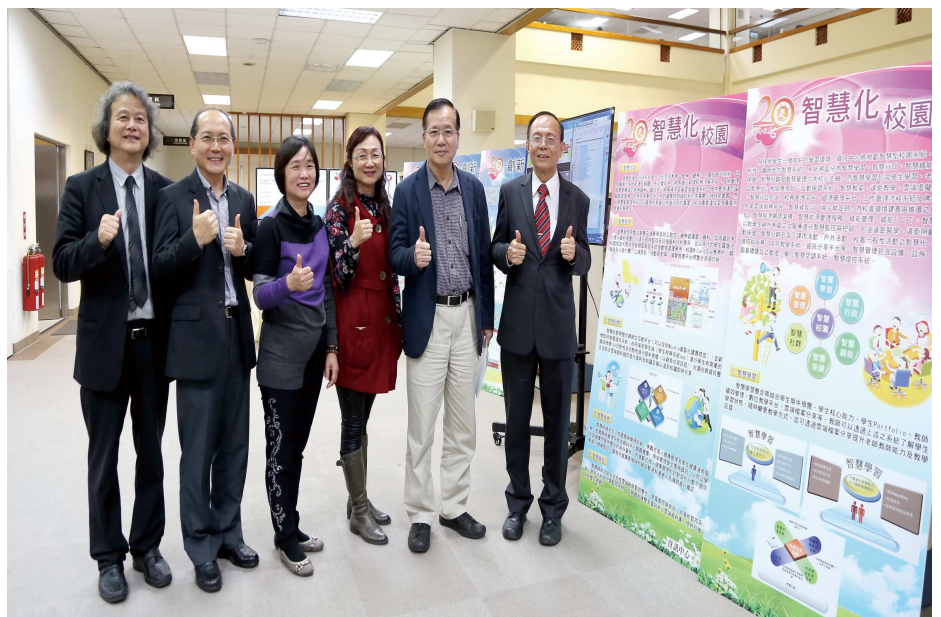
◆全校師生總動員，校務成果展率先登場。