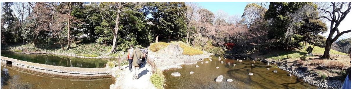
《小石川後樂園全景》