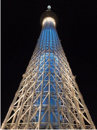
《東京晴空塔/ Tokyo Skytree》