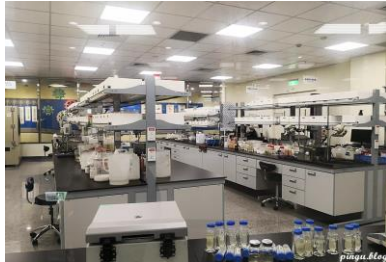
台塑生醫 完成高精度新冠肺炎快篩試劑開發