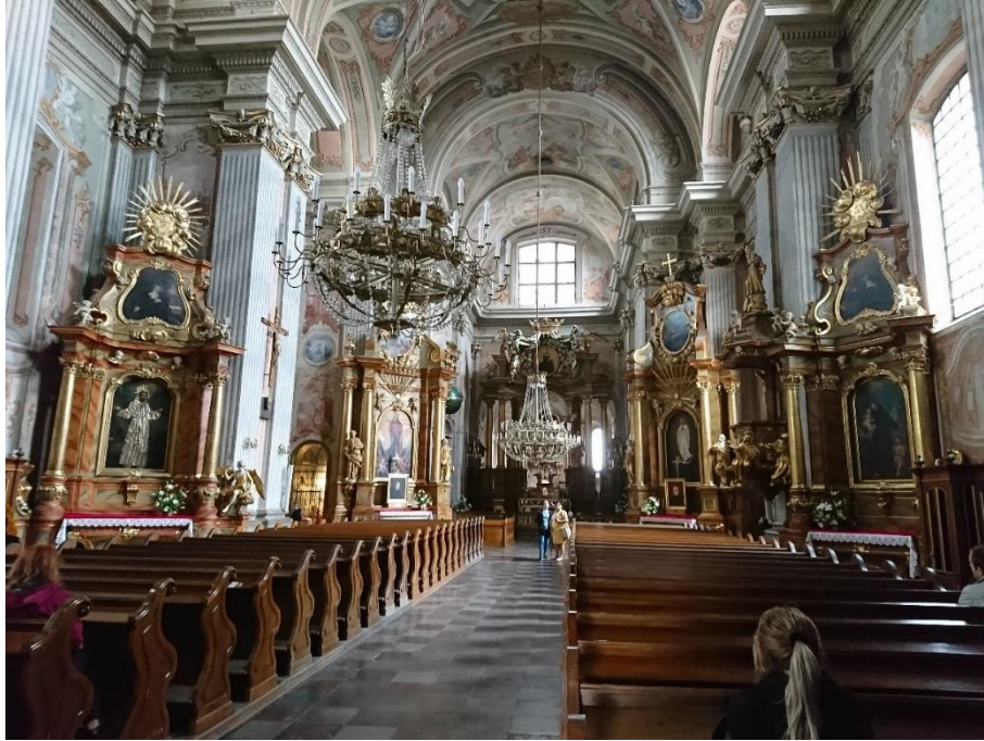
Figure 3 聖安妮教堂(Kościół św. Anny)