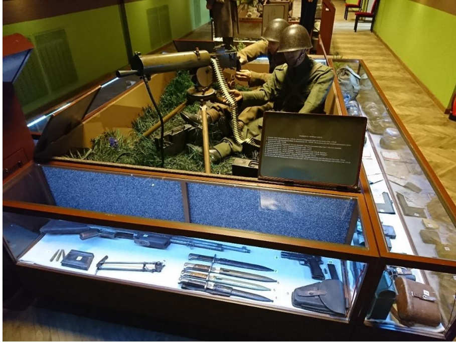
Figure 15 Białystok 陸軍博物館