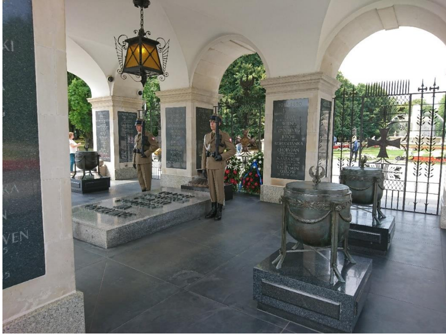
Figure 5 无名战士墓