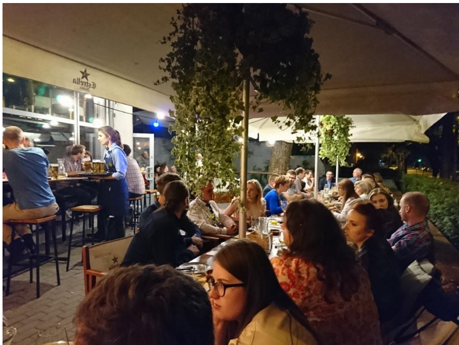
Figure 16 研討會第二日的晚宴