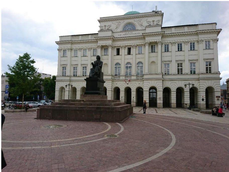
Figure 6 哥白尼博物馆