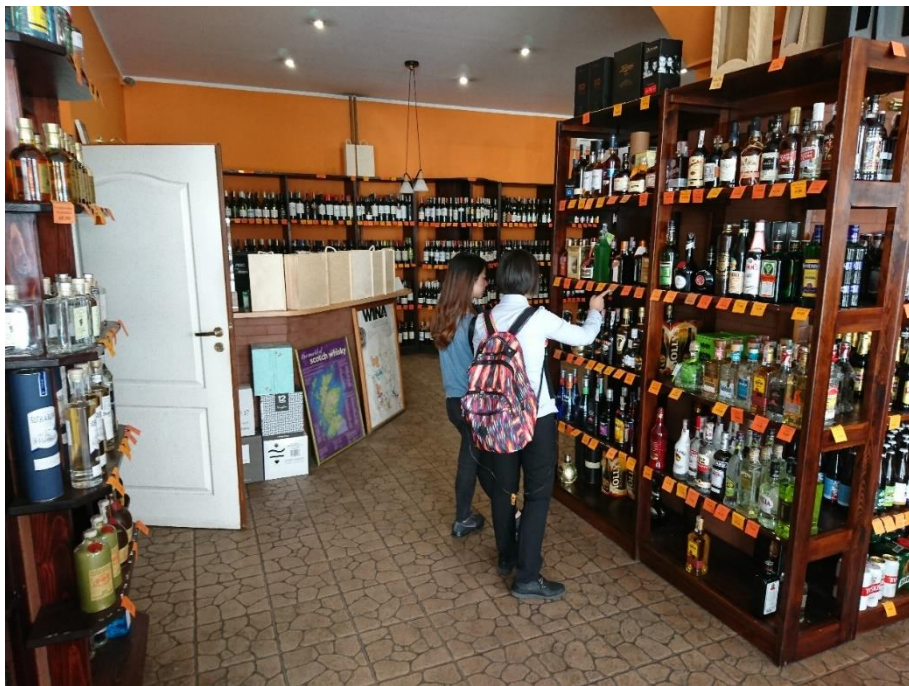
Figure 14 Białystok 的酒庄