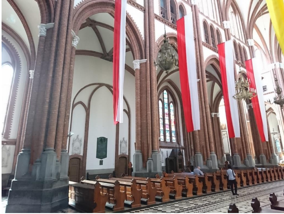
Figure 13 天主教聖母瑪利亞大教堂