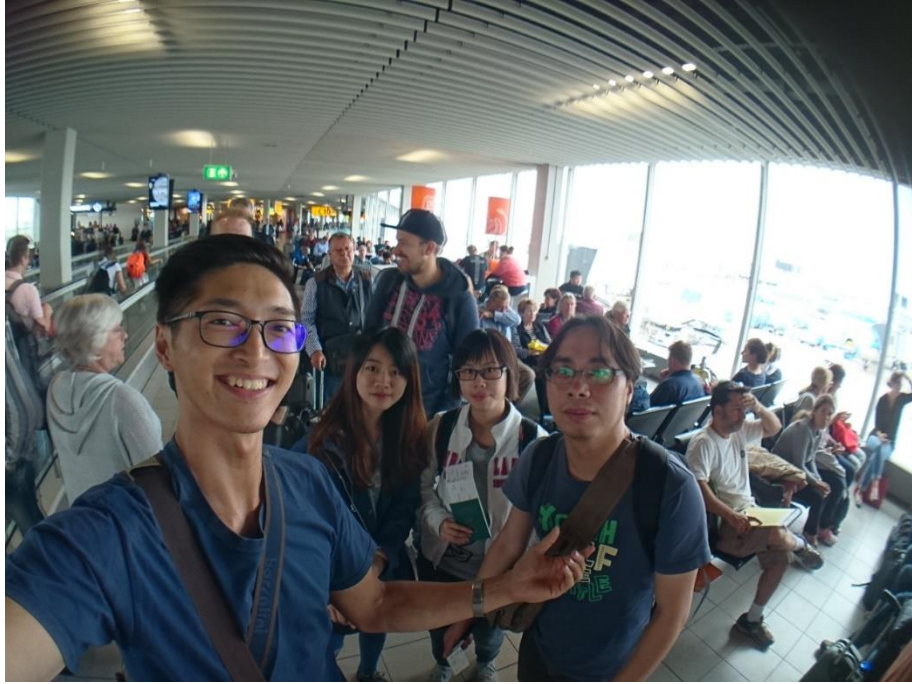
Figure 1 準備轉機到 Warsaw