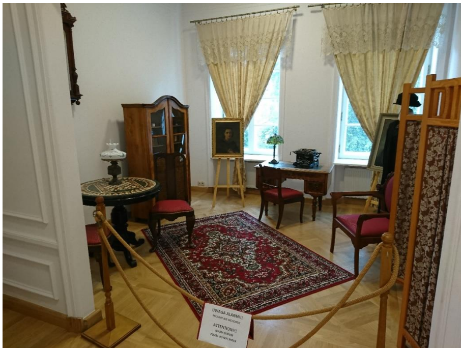
Figure 4 居禮夫人博物館