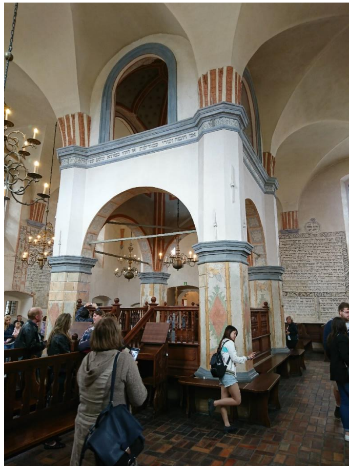
Figure 18 蒂科欽猶太教堂