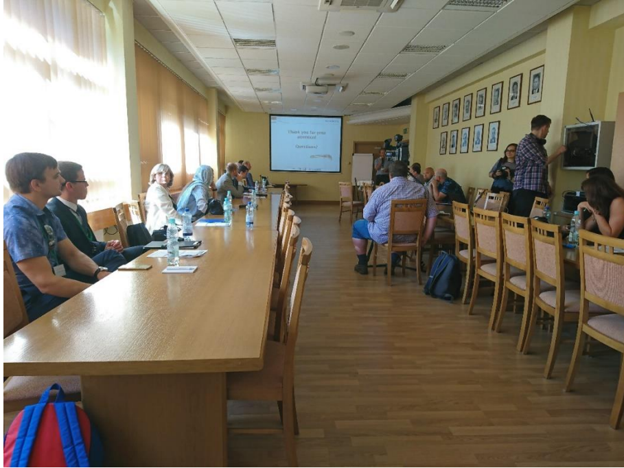
Figure 11 Plenary session 發表會場