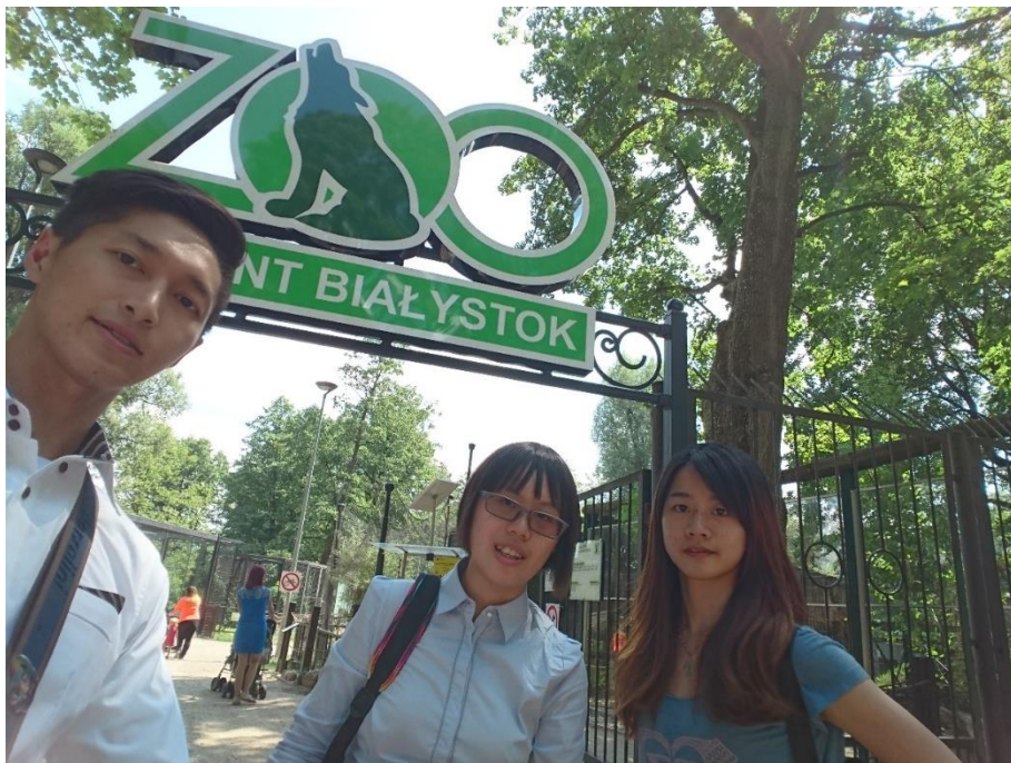
Figure 12 Białystok 動物園