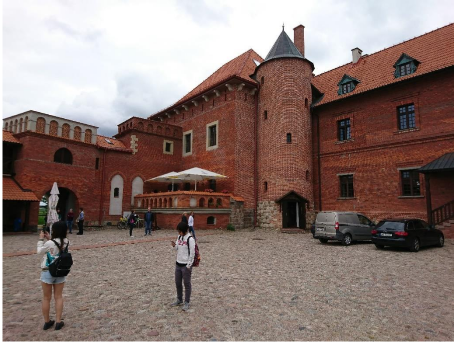
Figure 17 蒂科欽城堡