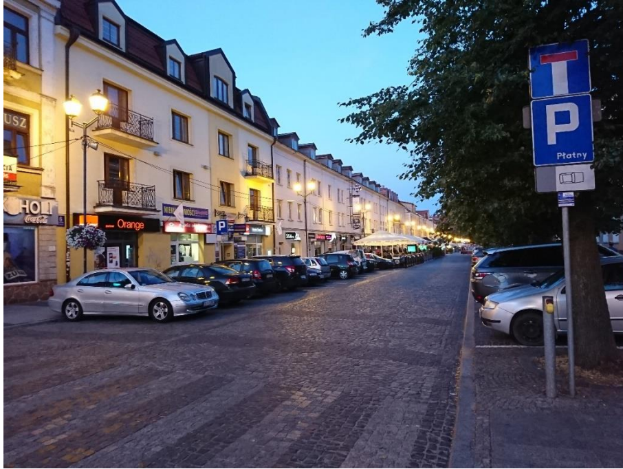
Figure 7 Białystok 夜晚街景