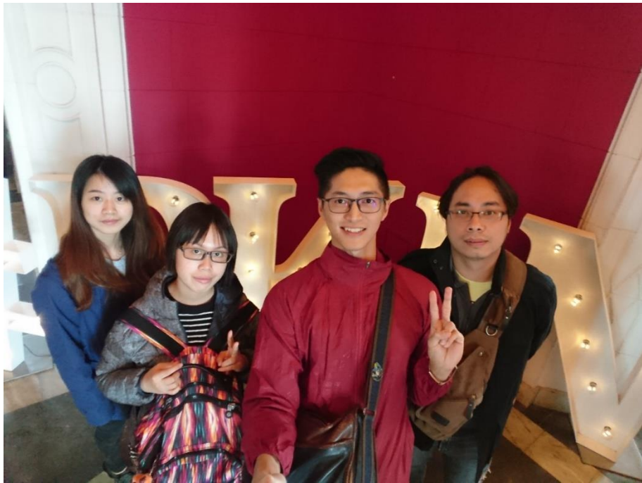
Figure 2 來到 PKiN 進行城市鳥瞰