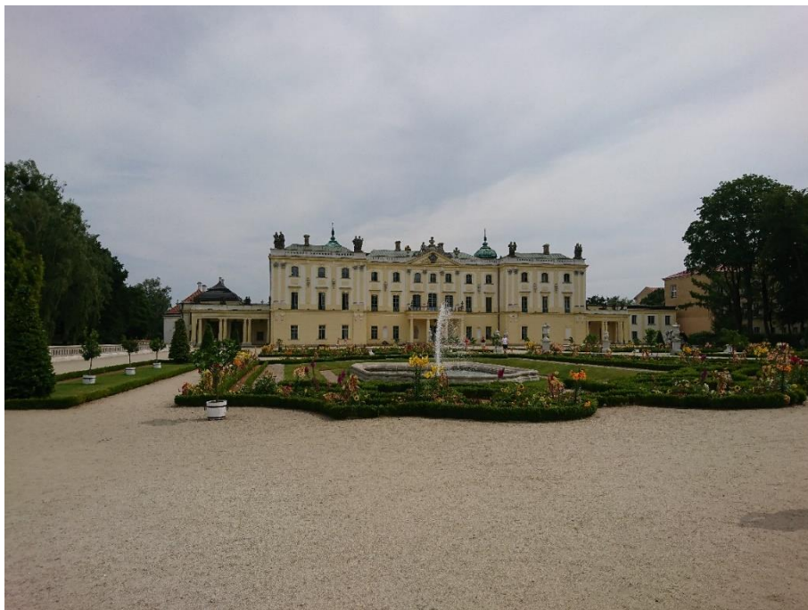
Figure 8 布蘭尼基宮