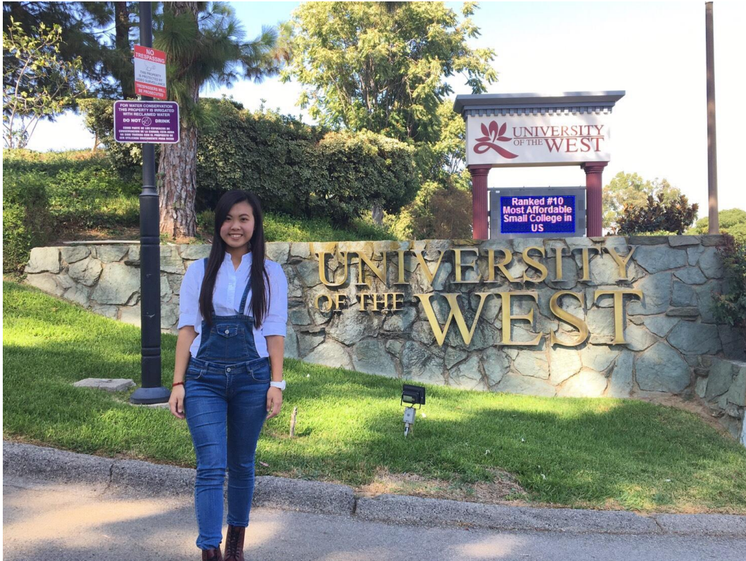
(海外學習期間最具代表性照片一張)