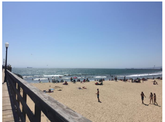
Santa Monica 和 Seal Beach