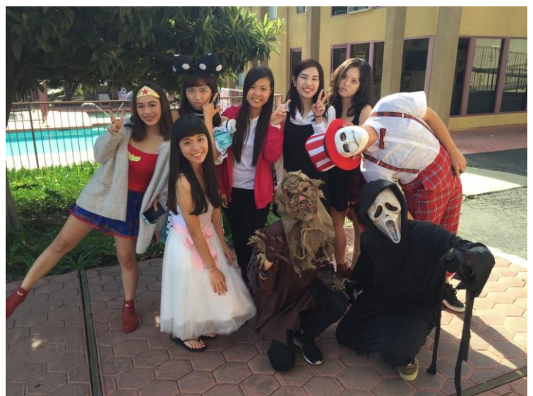
Halloween 活動與餐廳廚師的創意