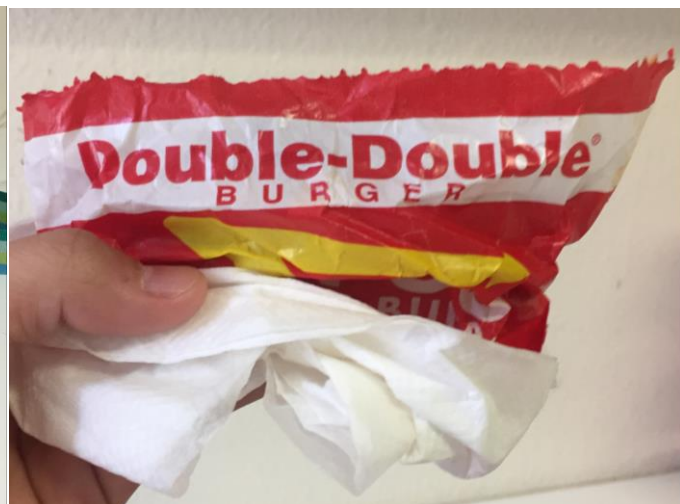
IN-N-OUT 的 Double-Double burger