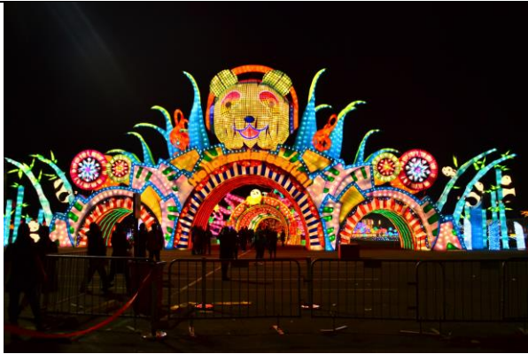
花旗球場「你好熊貓」燈會展