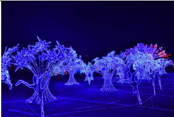
花旗球場「你好熊貓」燈會展