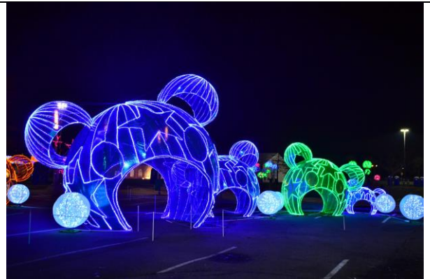
花旗球場「你好熊貓」燈會展