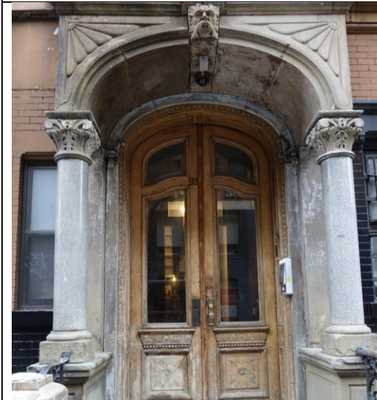
下東城廉租公寓博物館外面