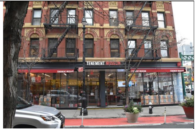
下東城廉租公寓博物館外面