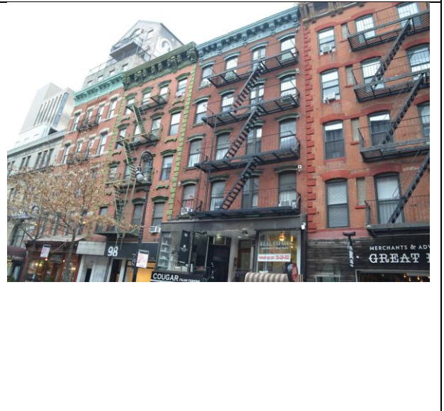
下東城廉租公寓博物館外面