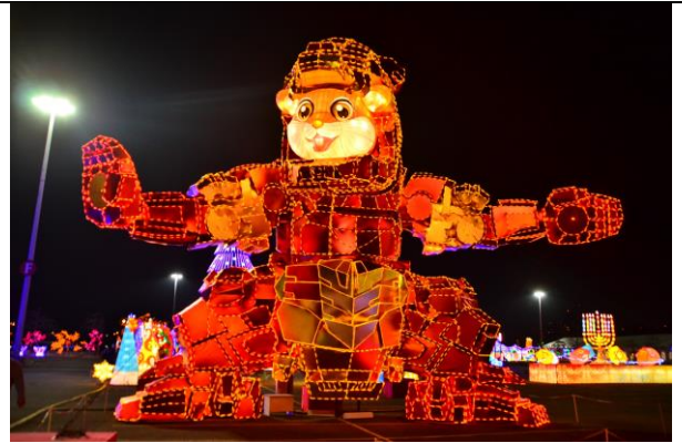
花旗球場「你好熊貓」燈會展