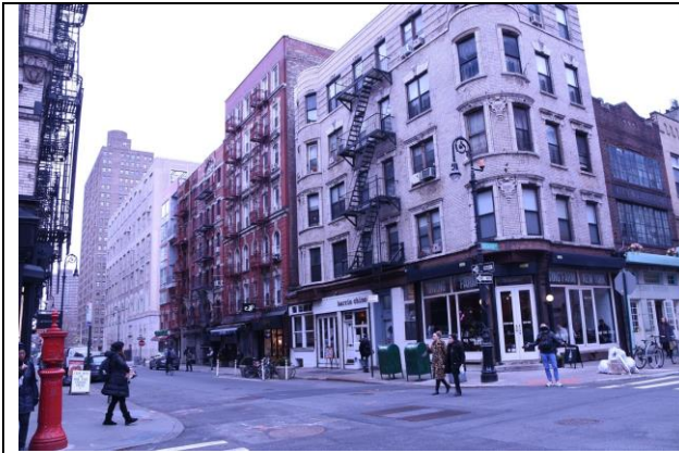
下東城廉租公寓博物館外面