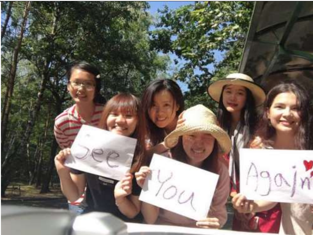
離開波蘭前與外國朋友們的合照