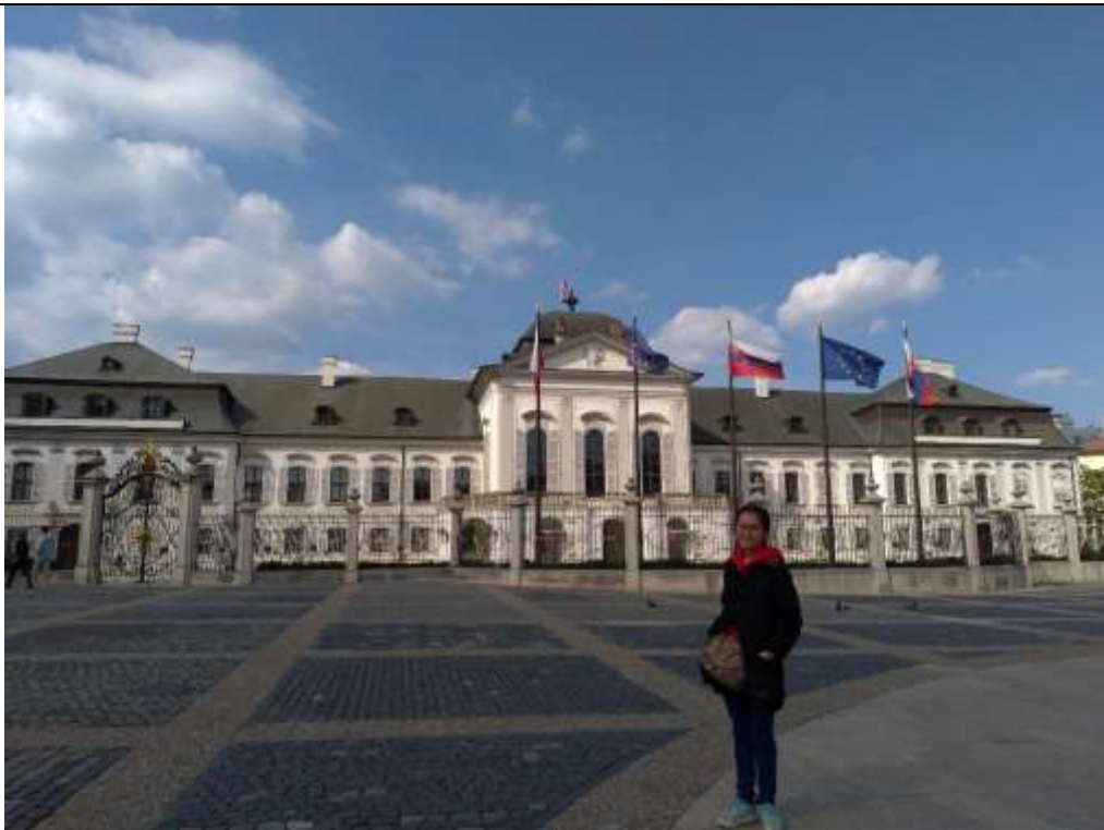
斯洛伐克布拉提斯拉瓦－總統府