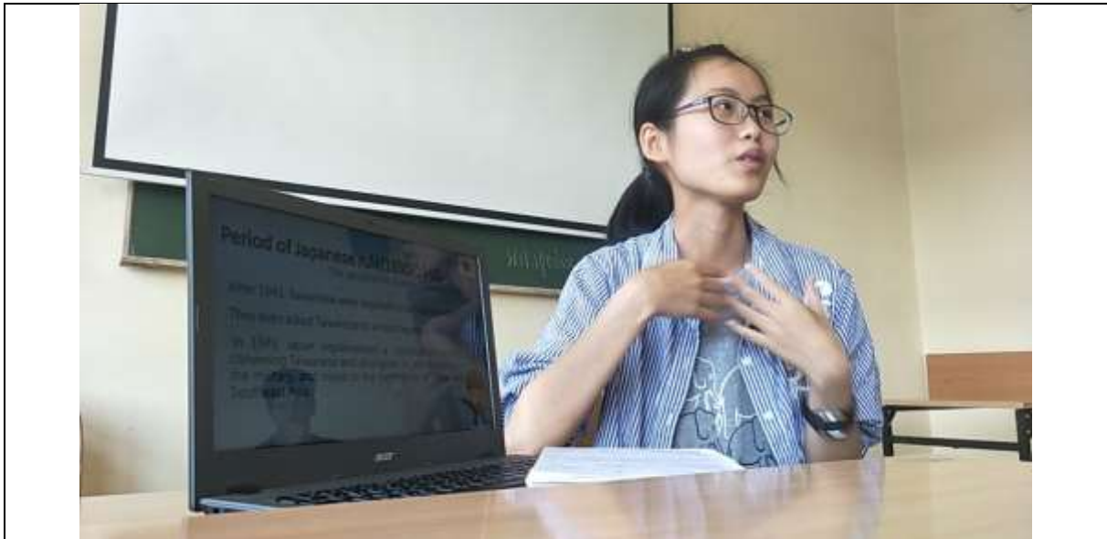
Politics and Contemporary History in Central Europe – 課堂報告 & 問答