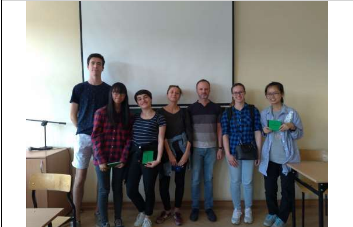
Politics and Contemporary History in Central Europe – 課程期末大合照