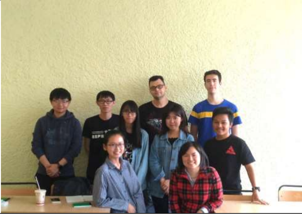
Modern Public Relations 一旁聽課程期末大合照