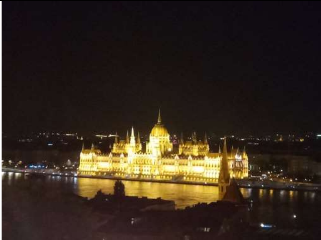
匈牙利布達佩斯－國會大廈（夜晚）