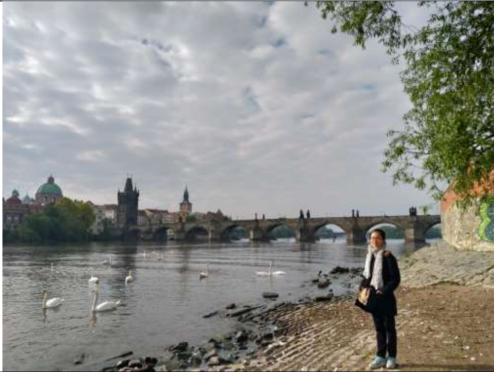
捷克布拉格—查理大橋