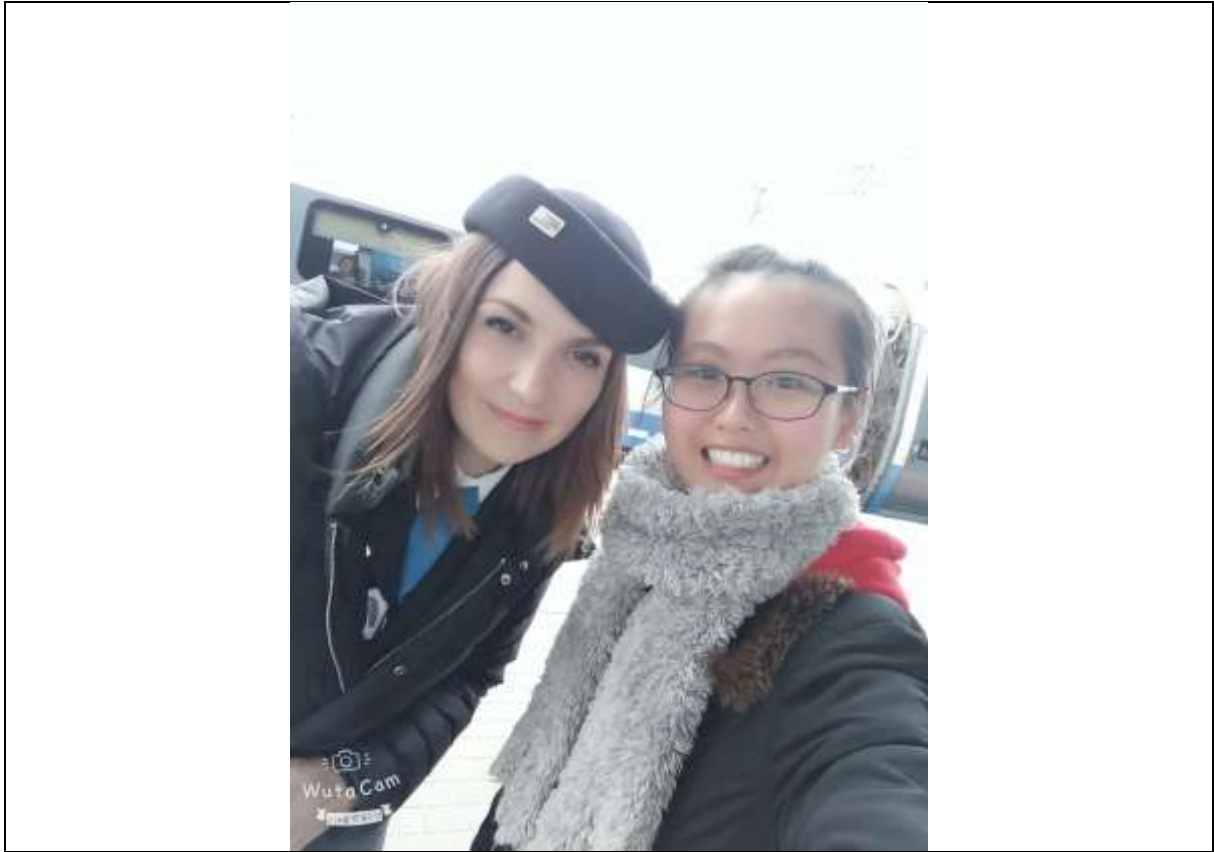
火車坐過站時，給予很大幫助的美女列車長