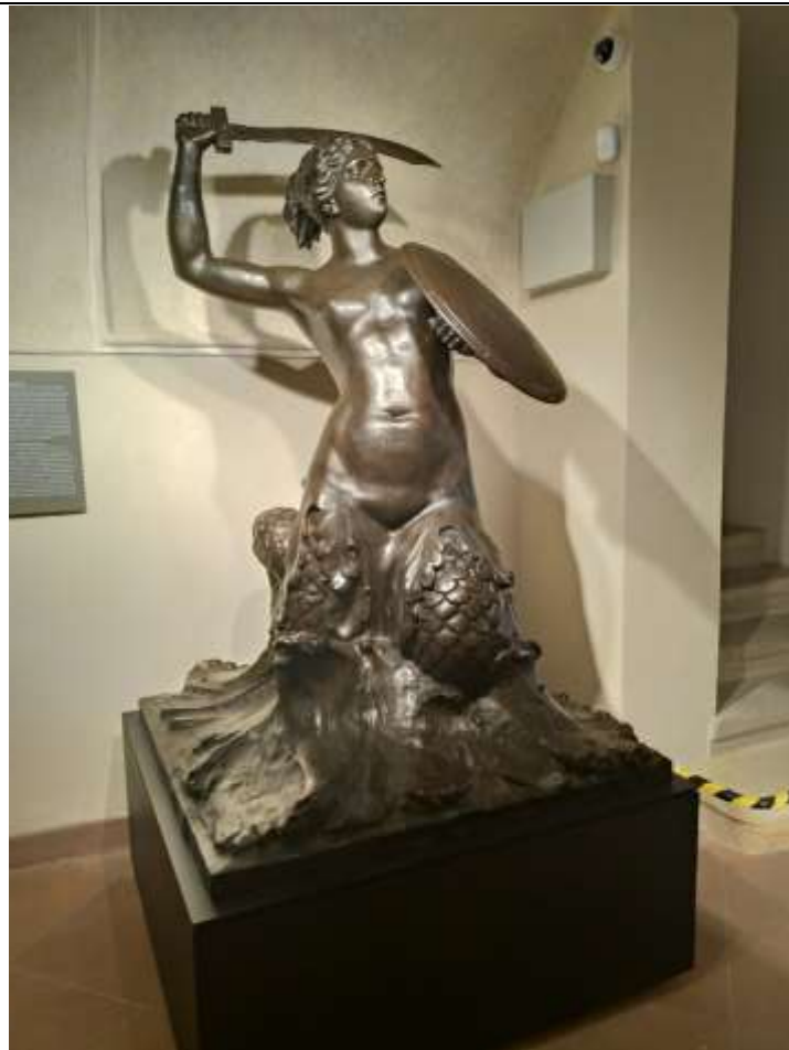
波蘭華沙—美人魚雕像