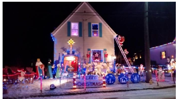
聖誕節房屋燈景裝飾