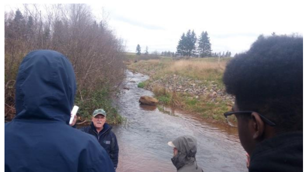
野外考察-教授解說河川系統