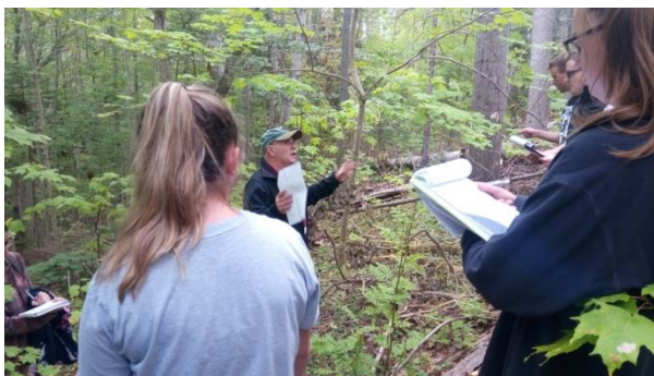
野外考察-教授解說森林系統