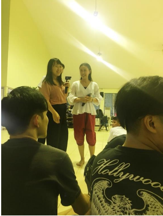
◀圖三 舞蹈指導老師