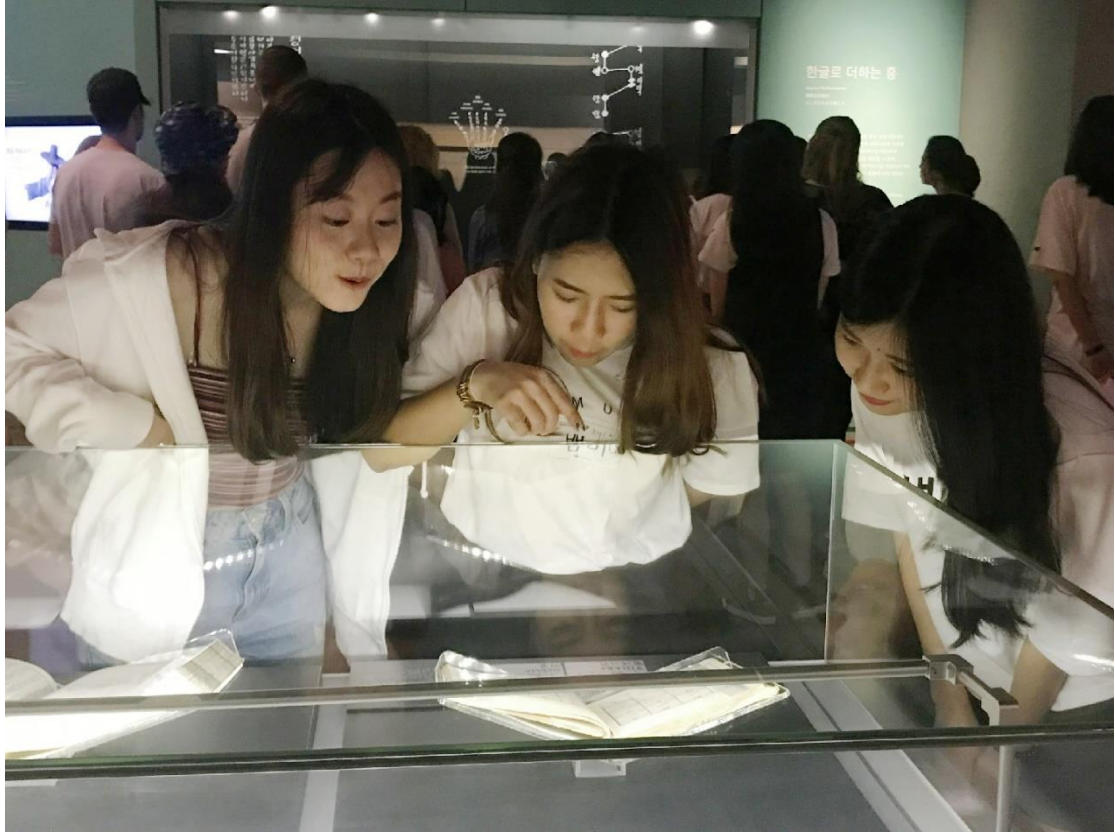
3. 上課照片(課堂禁止拍照錄影，所以照片很少)